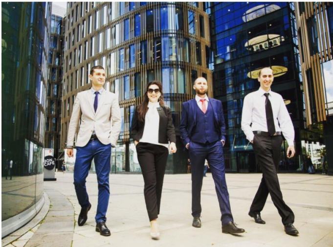
Петербургцы редко страхуют свои новые квартиры - Эксперт bpn.ru

#страховка #страхование #страханет #квадраты #лучшееагентствонедвижимости #недвижимость #безопасно #сделка #квартира #титул #дома #бизнес #коммерция #страхованиедома #страхованиеквартиры #надежность #деятельность #аренда #найм #продамквартиру #сдамквартиру #квартираспб #недвижимостьспб #новыйдом #новостройка #estate #sivovae