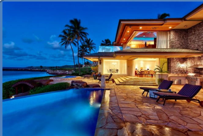
Дом у моря