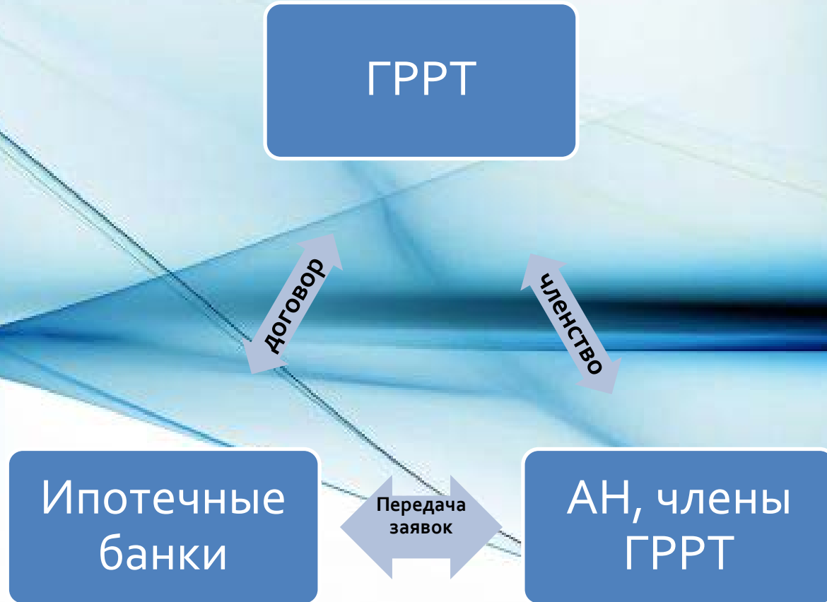
Схема работы ГРРТ с банками расположенными в г. Казань