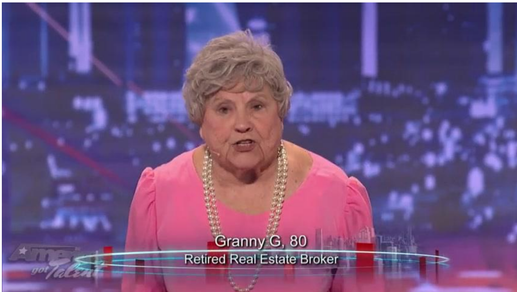
Granny G, 80 Retired Real Estate Broker